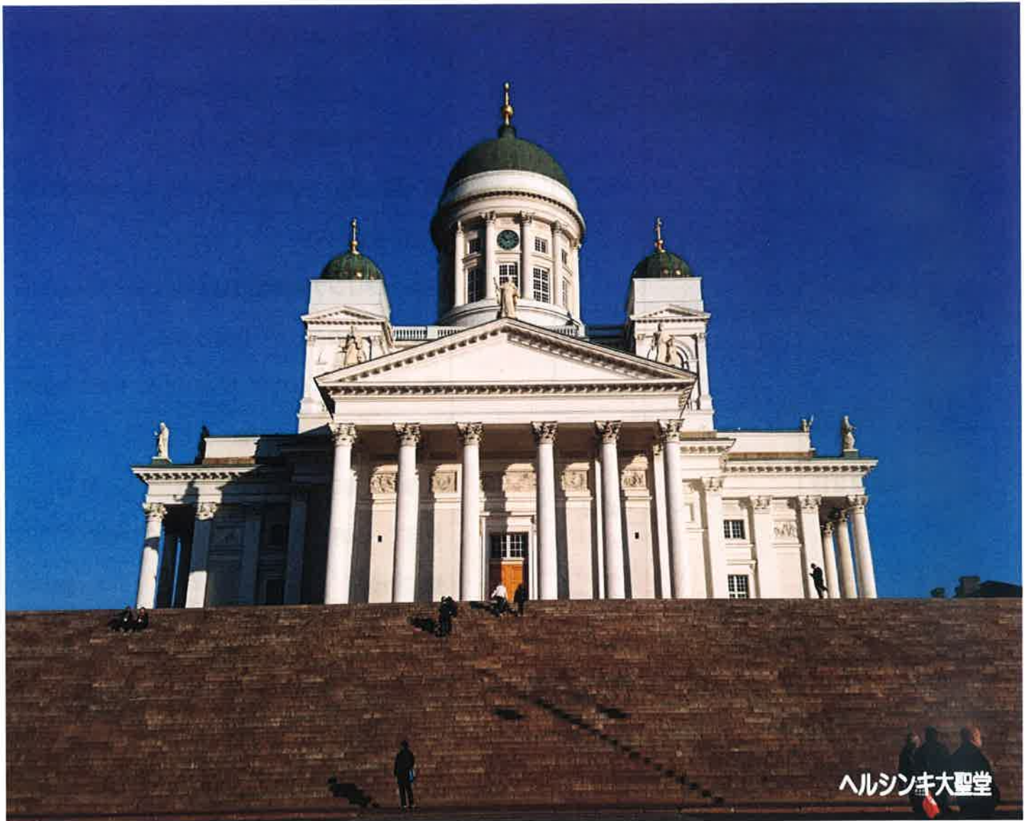
ヘルシンキ大聖堂

関西空港発着、10名様以上参加時 添乗員同行 (燃油サーチャージ、空港税、代行料など別途必要)